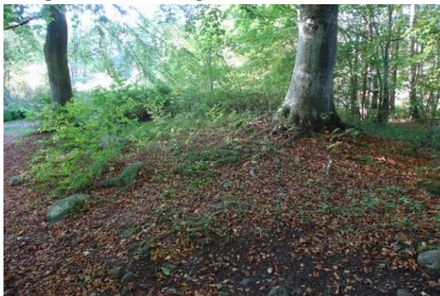
Langdysen er dækket af store bøgetræer

Det er naturstyrelsen som ejer området omkring naturcenteret og en pleje af langdysen bør ske. Den opsatte informationstavle er meget informativ, og indeholder en QR-kode.