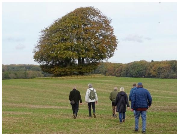
Gruppen på vej mod runddyssen nr. 332256

https://photos.app.goo.gl/2DcLsp9th4FN4wK49