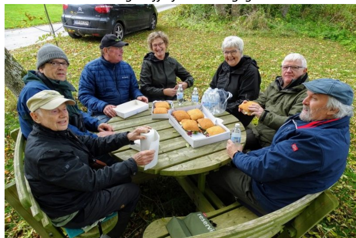
Frokost ved gadekæret i Fjenneslevmagle

Udover besigtigelsen beskæftiger DN Sorø's Natur- og Fredningsgruppe sig primært med natur- og landskabsfredninger, herunder det, der foregår i den del af Åmosen, som er beliggende i Sorø kommune.