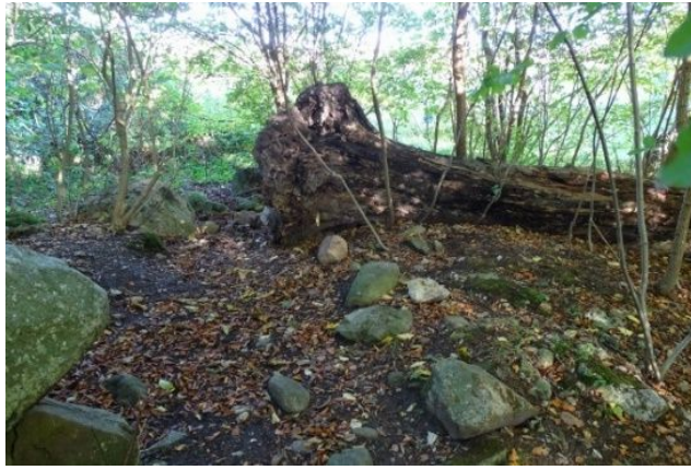
Den væltede bøg har revet en stor del af langdyssen op

Anbefaling: Da fortidsmindet befinder sig på Naturstyrelsens areal ved Kongskilde Naturcenter, vil det være naturligt at bede Naturstyrelsen sørge for at fortidsmindet bliver plejet, herunder at snebær fjernes.