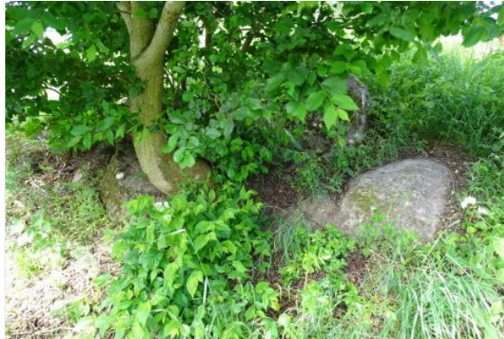
På bagsiden kunne enkelte randsten anes, under nedbrydning af en aggressiv elm