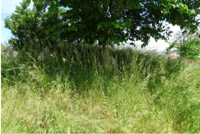
Den skjulte langhøj overfor Tygestrupvej 2

Langdysse NNØ-SSV. 2 x 11 x 41 m. Randsten: 15 V, 4 S, 17 Ø. Kammeret ligger 15 m fra højens nordende, 3 af sidestenenene ses. Dæksten borte. Over dyssen skeldige. Højens vestlige del en del forgravet og afgravet.