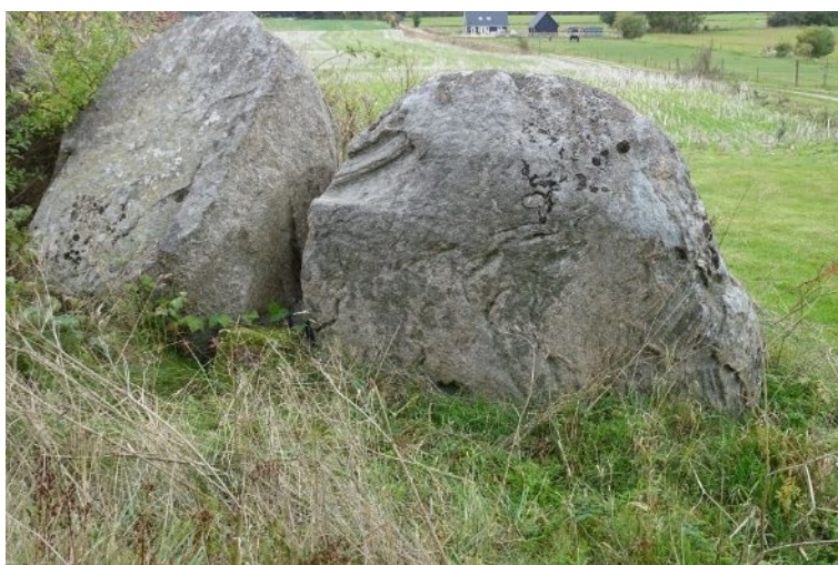
Randstenene er store og flotte

Af planter blev fundet: Alm. Hyld, Slåen, Vild Kørvel, Prikbladet Perikon, Gul Snerre, Alm. Gedeskæg, Vild-Æble, Stor Nælde, Hvidtjørn, Hindbær, Korbær, Kruket Skræppe, Ager Tidsel, Alm. Syre, Alm. Hundegræs og Gederams.