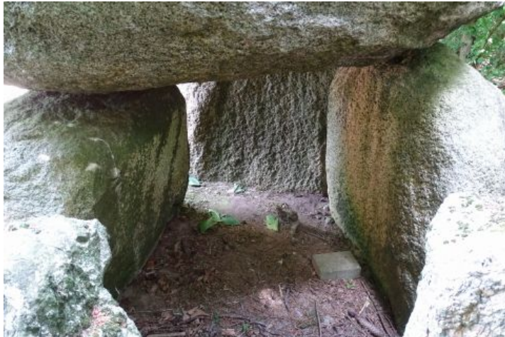
Kammeret på den flotte og velbevarede langdysse fra stenalderen