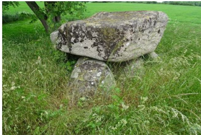
Ved forcering af mindesmærket kunne de 2 flotte kamre besigtiges, her det nordligste.