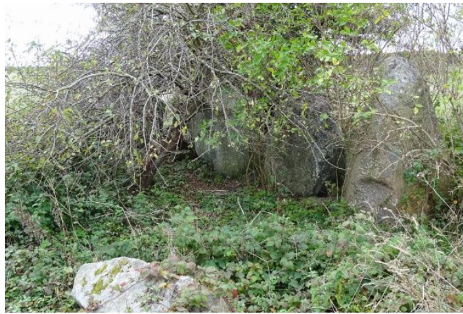
De fleste af de store randsten er skjult i opvækst