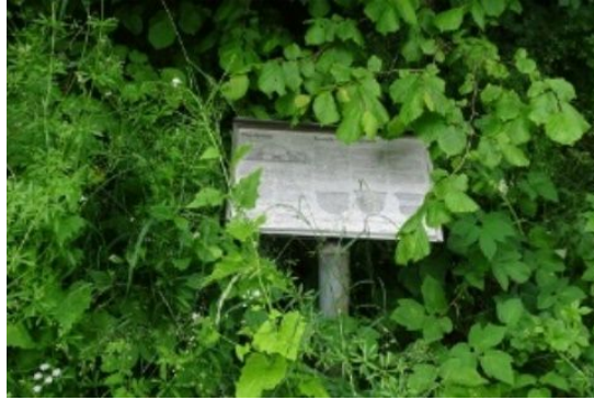
Informationstavlen er skjult, ramponeret og svært tilgængelig – stammer fra Vestsjællands Amtskommune