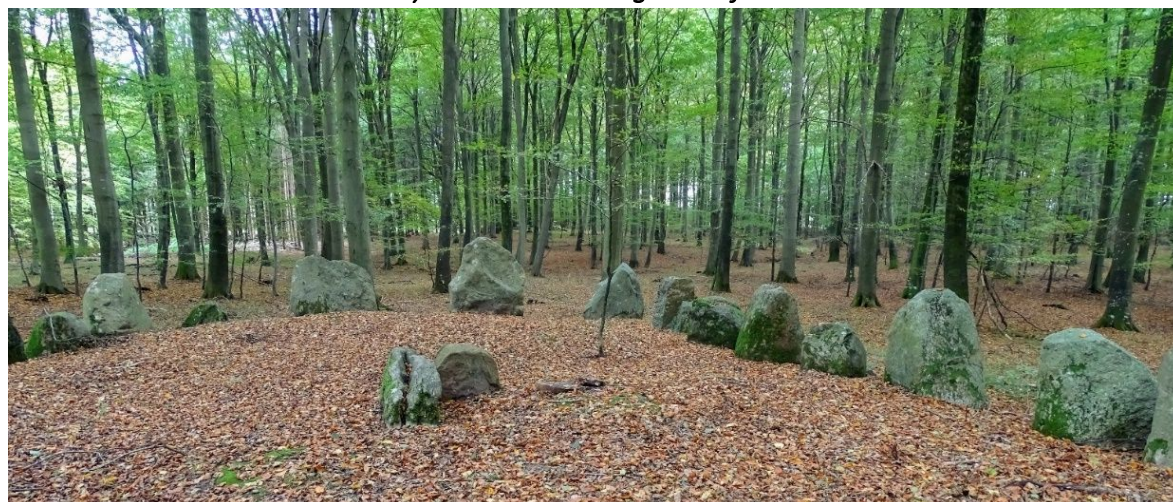
Dyssen i Vindelbro Skovpart