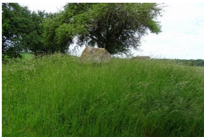
Vielsted langdyssen var tæt overgroet med græs

Langhøj, 1,5 x 15 x 23 m NNØ-SSV. Heri 2 kamre. Det NNØ kammer firesidet, af 5 bæresten og 1 dæksten mod V yderligere 2 sten, det ene vist tærskelsten, den anden gangsten. Det SSV-lige kammer dannet af 1 sidesten mod V, 2 mod Ø og 1 mod S, mod N en lavere tærskelsten, 1 sten umiddelbart N for kisten Måske en gangsten.