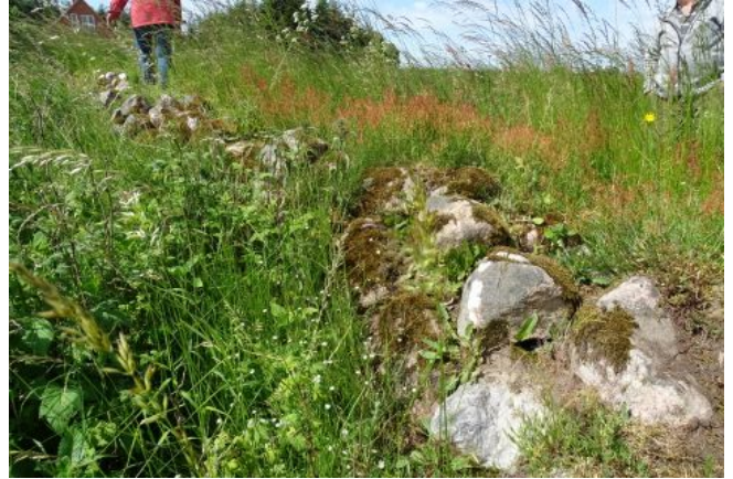
På toppen, i forlængelse af langhøjen, var et skeldige