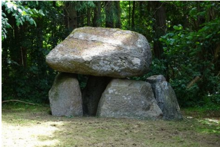
Flot og velbevaret langdysse fra stenalderen (dateret 3950 – 2801 f.Kr.)

Dyssekammer, 5 bæresten, hvoraf den nordlige endesten er skredet lidt ud; stor dæksten. Dæksten blev sat tilbage på plads i 1988 for at undgå nedskridning.