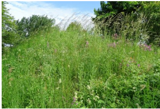
Svært at erkende som et fortidsminde