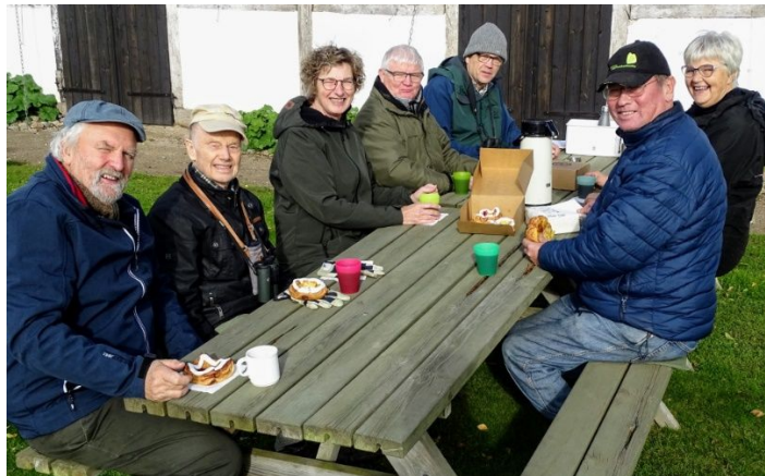
Formiddagskaffe foran Kongsgaarden

Ovenstående besigtigelse er gennemført af DN Sorø's Natur- og Fredningsgruppe, men har været åben for alle aktive i DN Sorø. At ikke alt er rent arbejde kan ses på disse billeder, taget undervejs i forbindelse med den seneste besigtigelse.