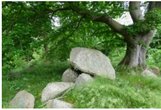
Fortidsmindet på Merbjergvej ved Niløse er absolut betragteligt med en lang række store sten, men også med meget store træer og en masse krat.