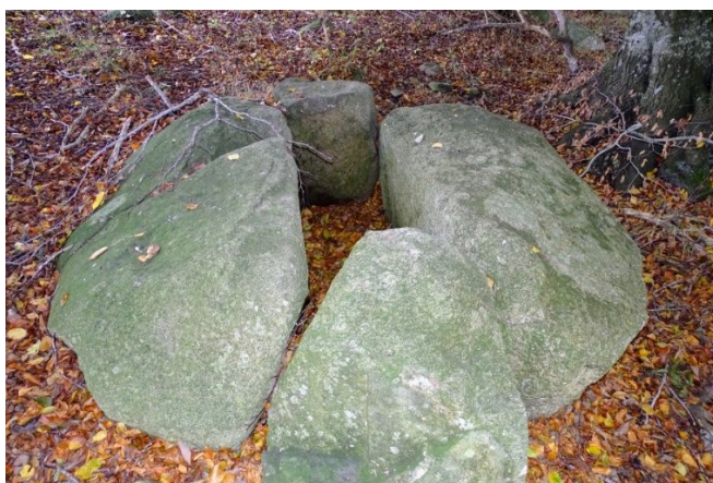
Det ene kammer på Fredningsnr. 332255

Anbefalinger: En nænsom pleje i form af fjernelse af nedfaldne grene, gamle vindfælder og indtrængende kratbevoksning er velkommen, ligesom opmærksomheden på de 2 m respektafstand til randsten eller foden af højen, bør skærpes en smule.