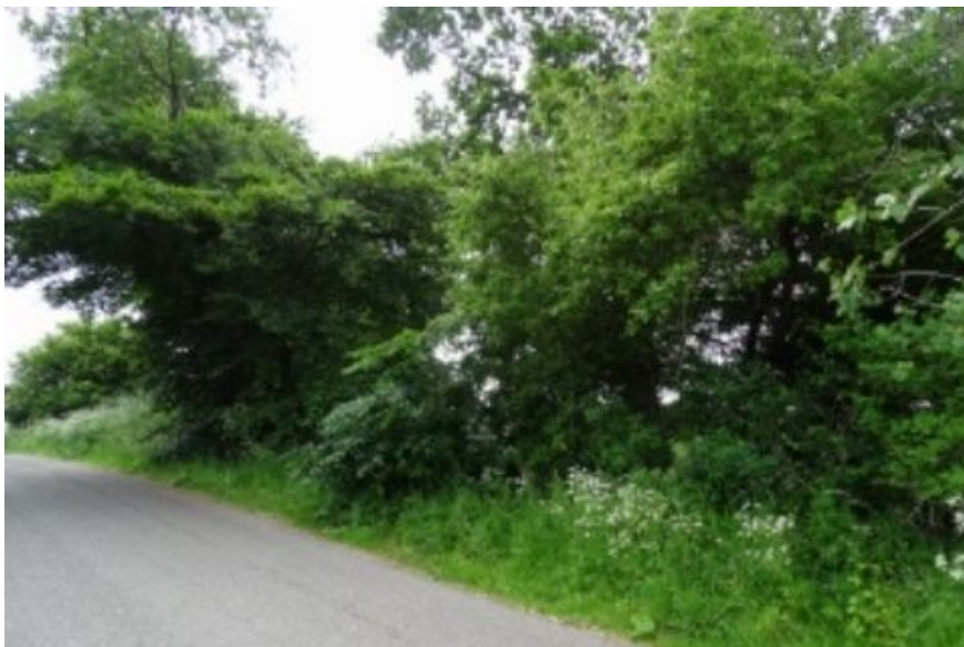
Det er ikke til at se, at der bag dette krat gemmer sig et anseeligt fortidsminde ved Niløse.

Randsten: N 25, S 26, V 1, Ø 1. En del større spredte sten. En stor bøg og hasselkrat. Anseeligt mindesmærke.