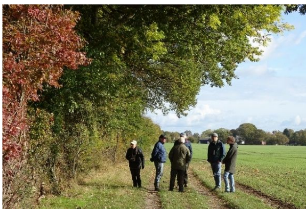
DN Sorøs Natur- og fredningsgruppe ved det beskyttede stendige med de flotte, gamle egetræer.

Stien går på stedet ved dyssen langs et beskyttet stendige (DigeID: 118708), som dog er delvis skjult bag en række buske, og hvor der bagved vokser en del japansk pileurt, som burde bekæmpes. På og ved diget vokser der en række meget gamle og flotte egetræer.