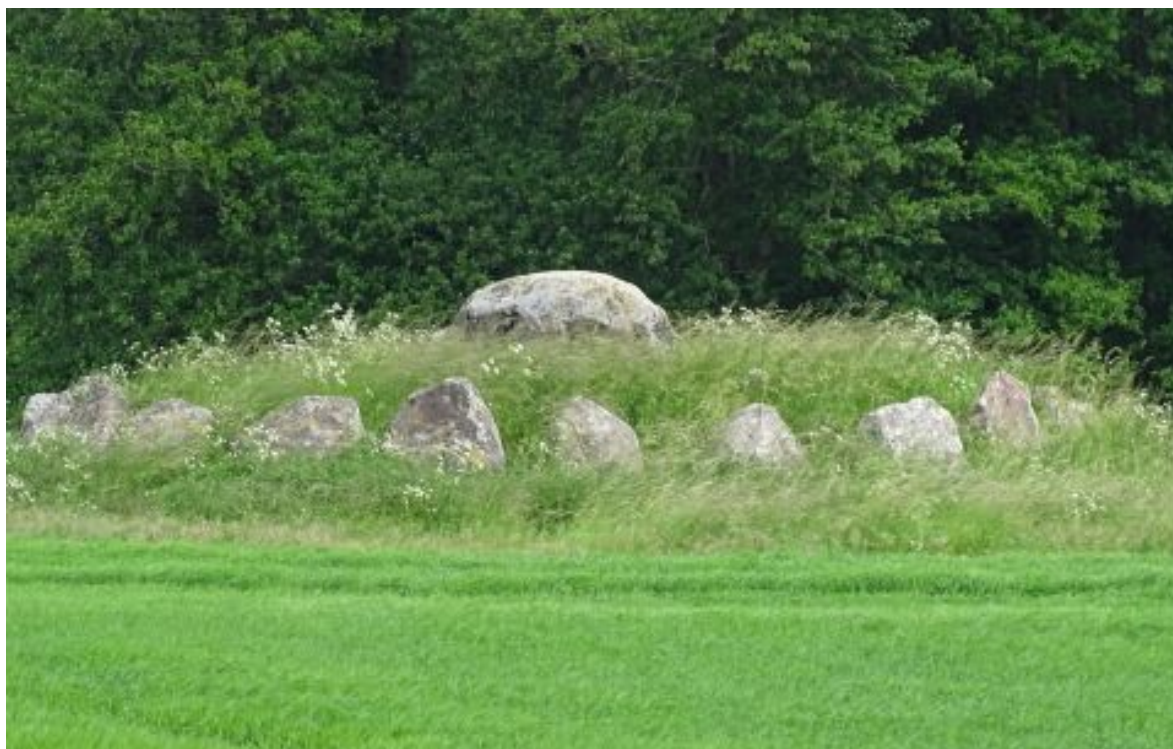
Vielsteddyssen i den nordlige del af kommunen