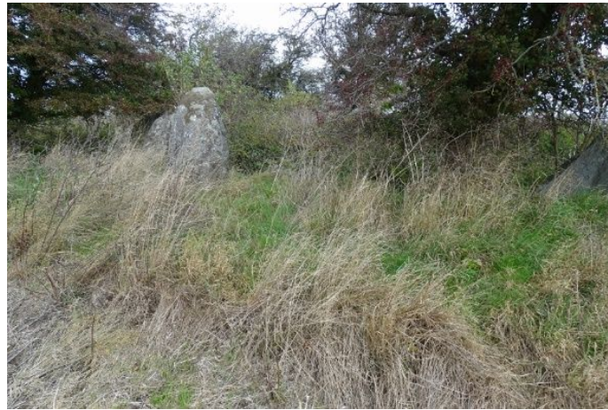
Udefra er det svært at erkende langdyssen som sådan

Anbefaling: Udarbejdelse af en vejledning til pleje af fortidsmindet til ejer og vedligeholder samt udarbejdelse og opsætning af en ny informationstavle.