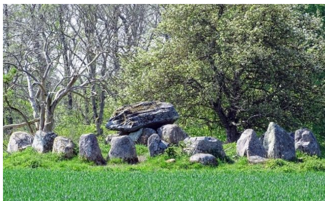
Arkivfoto af Mølsøvdysse

Stien går på stedet ved dyssen langs et beskyttet stendige (DigeID: 118708), som dog er delvis skjult bag en række buske, og hvor der bagved vokser en del japansk pileurt, som burde bekæmpes. På og ved diget vokser der en række meget gamle og flotte egetræer.