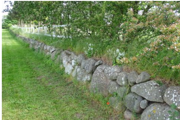
Foran fortidsmindet var et meget smukt og vedligeholdt, beskyttet stendige (DigeID: 120726)