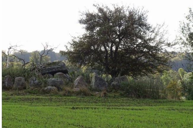
Mølsøvdysse som den ses fra stien d. 16. oktober 2021

Da DN Sorø besigtigede stedet i efteråret 2021, var det ikke muligt at bese fortidsmindet pga. nysået korn. Tidligere har det været muligt at bese det meget smukke fortidsminde, som tidligere har været plejet, men som nu synes at gro til.