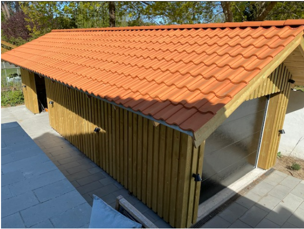
Garage med cykelskur