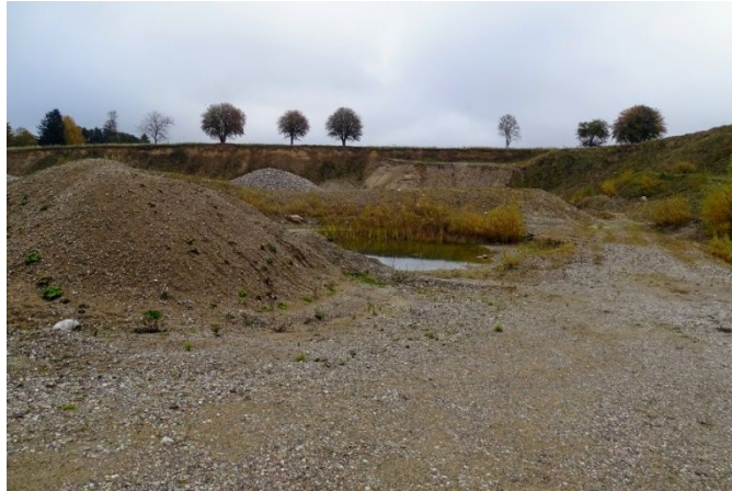
Råstofgraven på Parnasvej 45 med vandhuller som sagtens kunne være fouragerings- og ynglesteder for Bilag IV arter

DN Sorø har i en anden råstofgrav i Kommunen indgået en succesfuld aftale, som specifikt har omhandlet forekomst af strandtudse, en mulighed, som absolut også er til stede i råstofgraven på Parnasvej.