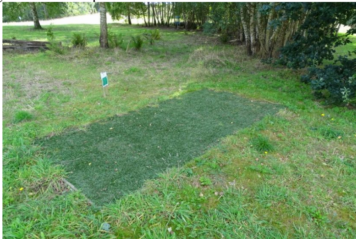
En af de udlagte udkastningsmætter i samme niveau som græsset omkring

Det fortsatte problem er pleje af området, som sker med større maskiner, hvor en række af udkastningsstederne synes at blive slået med disse maskiner, hvilket betyder at kunstgræsset bliver slået, hvorved plastic fra kunstgræsset bliver spredt i naturen.