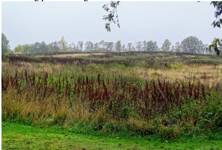
Oversigt over det foreslåede graveområde på Smedevej 54 efter at den tidligere plantage er fjernet og området har været udyrket i nogle år.

Region Sjælland vurderer, at der med de fastsatte vilkår til bevarelsen af spredningsevnen for hasselmus, kan gives tilladelse til råstofindvinding på det ansøgte areal.”