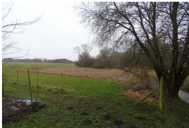
Den beskyttede eng langs Tude Å som indvinder ønsker at grave ind i

DN Sorø har d. 18. februar 2022 sendt en klage til Miljø- og fødevareklagenævnet over afgørelse om dispensation fra åbeskyttelseslinjen til råstofindvinding og over dispensation fra §3 beskyttet natur på adressen, en klage som vi har fået besked om fra klagenævnet, at de forventer at kunne færdigbehandle inden udgangen af december 2022.