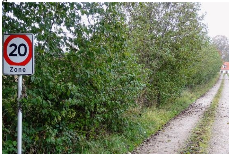
Det meget lidt anvendelige hegn for spredning af hasselmusen langs Gammel Smedevej

Den eksisterende spredningskorridor er ikke udvidet, som beskrevet i klagenævnets kendelse, så hasselmusens spredningsmuligheder er meget dårlige, herunder også fordi der findes et meget stort, åbent område ved starten af hegnet.