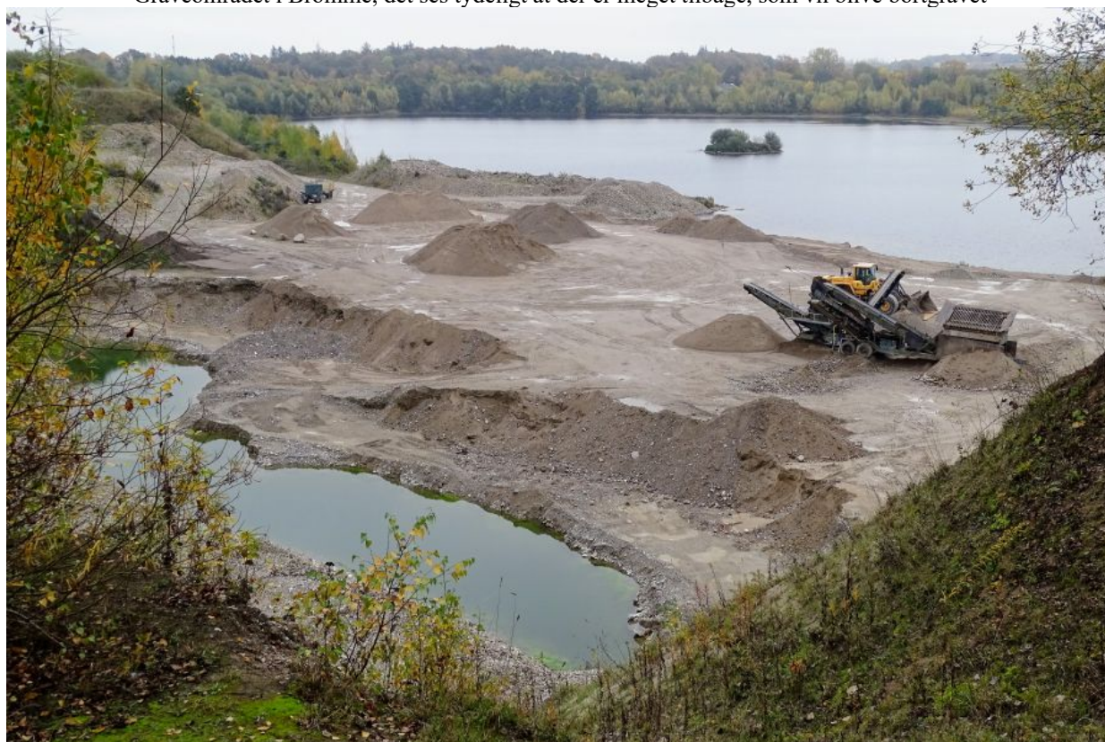
Billedet er taget fra et punkt nederst på kortet og har udsigt over det offentlige område på Kalundborgvej/Løngvej

Stiftelsen Sorø Akademi, som er ejer af området, har flere gange indbudt til en dialog om området, og har bedt om idéer til hvad området kan anvendes til efter endt gravning. Stiftelsen lægger op til at 1/3 skal udlægges til natur, mens det resterende område ønskes udlagt til andet formål, gerne noget, som kan give lejeindtægt til Stiftelsen efterfølgende, herunder også mulighed for støjende aktiviteter. Der har været nævnt motorbane og vandscooter bane.