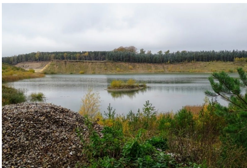
Graveområdet på Plantagevej 7 med den dybe sø og en ø

Udgravningen ved Plantagevej 7 synes at være meget tæt på at være færdiggravet, men gravetilladelsen gælder indtil 01.02.2027. Af efterbehandlingsplanen fremgår det, at der ikke forventes at blive tilbagelagt noget overjord og at der forventes efterbehandlet til en stor sø. Der forventes en dybde af søen på op til 8 meter.