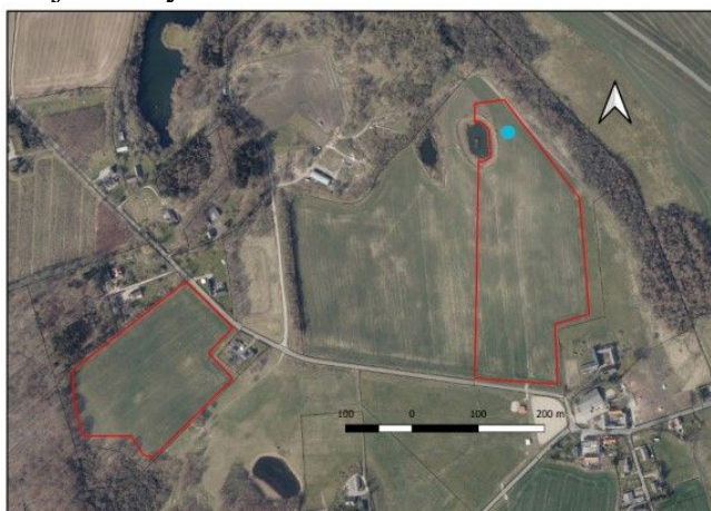
Det ansøgte areal er opdelt i to arealer og er vist på kortet med røde linjer. Den blå prik på kortet viser placeringen af vandhullet til vandindvinding.

Det modtagne kort, hvor Topshøj landsby ses nederst til venstre: