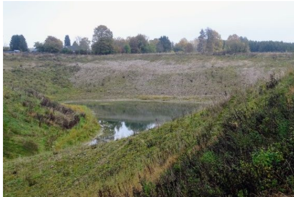
Fra den efterbehandlede råstofgrav

Der er ikke tilbageført overjord, så urter og træer er praktisk taget selv indvandret, med en stor variation til følge. Stedet bærer stadig præg af udgravning, men kan med tiden blive et dejligt, rekreativt område, hvilket dog er afhængigt af ejernes intentioner.