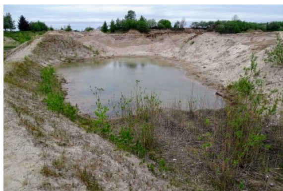
Tidligere etablering af vandhul til strandtudsens i området

Aftalen er efterfølgende blevet fornyet hvert år med nye skrab og ynglesucces til følge.