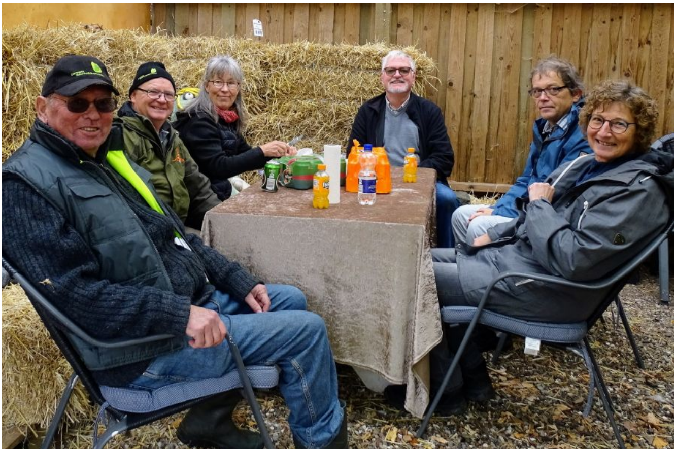
DN Sorøs arbejdsgruppe omkring Natur- og fredninger under rundturen, der skulle tankes op undervejs.

Mødet mellem DN Sorø, Sorø Kommune og Region Sjælland synes at pege fremad mod en mere bevidst strategi omkring råstofgravene, men politikernes interesse og lovgivningen halter gevaldigt bagefter, så konklusionen må være, at alle med interesse for natur og fritidsinteresser går sammen om at få politikerne interesseret i området.