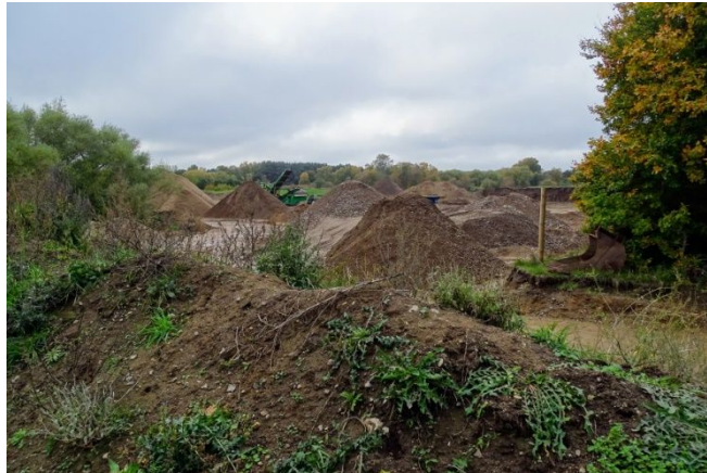
Den igangsatte indvinding ved Dyssevej 20

Ejere har af Region Sjælland fået tilladelse til at udsætte ibrugtagning af gravetilladelsen indtil 7. november 2022, og det kan DN Sorø så konstatere er sket, idet der tydeligvis er påbegyndt indvinding af råstoffer op mod Dyssevej.