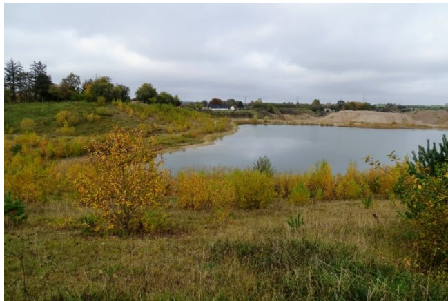
Udsigt over en lille del af råstofgraven med de mislykkede paddehuller til strandtudsens til venstre

Munke Bjergby grusgraven har gennem en årrække været et stort graveområde øst for Munke Bjergby. Der har været gravet i den sydlige del og da denne var færdiggravet, blev der etableret 3 paddehuller til strandtudsens, som var blevet konstateret ynglende i graveområdet. Vandhullerne har formentlig været anvendelige for strandtudsens de første par år, men efter det, groede de til, så strandtudsens ikke kan bruge dem.