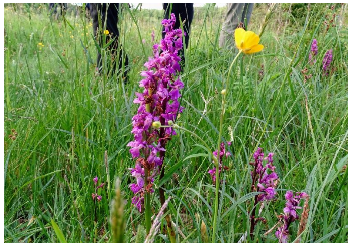
Tyndakset gøgeurt på Bimosen

Det blev en fin tur, hvor i alt 32 deltagere nød det gode, stille vejr og lyttede til de 3 kompetente guider som viste rundt på skovengen - Bimosen, som plejes af en flok veltilfredse køer overvåget af Kogræsserlaugets frivillige.