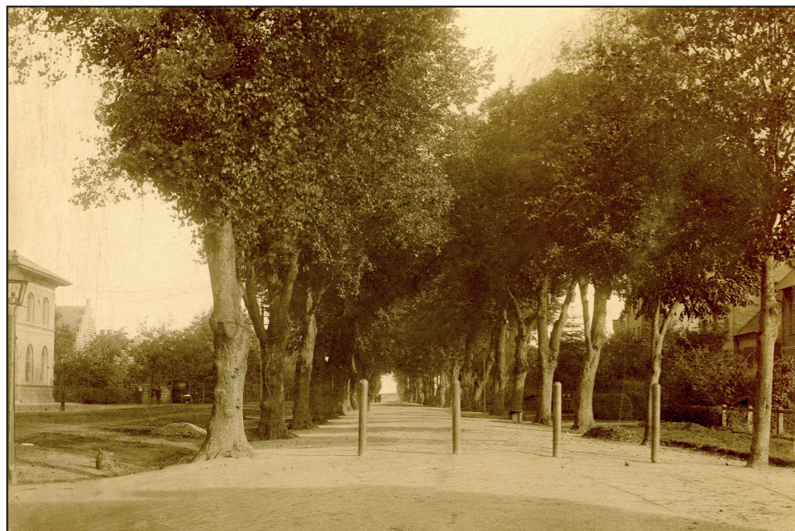
Reitzensteins Allé, måske efter der er fyldt jord på.