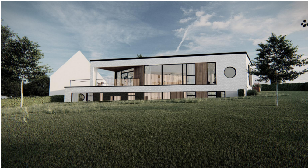
Perspektivtegning fra ansøgningen

Ejendommen ligger indenfor kommuneplanrammen Fr.B 1 Område nord for jernbanen. Jf. kommuneplanrammen kan området anvendes til boligformål med tilhørende fælles anlæg. Der er mulighed for at opføre åben lav bebyggelse, som højst må opføres i én etage med udnyttelig tagetage.