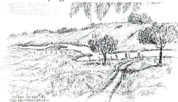
Tegning: Jørgen Løvgret, Sorø

I 2020 blev tidligere tiders gangbro over Susåen genetableret neden for Møllebakken. Via broen kan gående og cyklende nu krydse åen i smukke og fredelige naturomgivelser. Broen forbinder stierne omkring Vester Broby og Kongsgaarden nord for åen med den offentlige sti fra åens sydlige bred til Næsby og videre derfra.