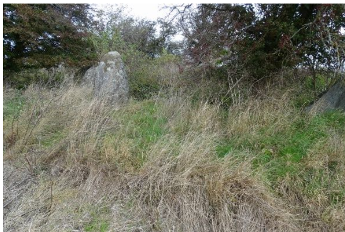
Udefra er det svært at erkende langdyssen som sådan

Anbefaling: Udarbejdelse af en vejledning til pleje af fortidsmindet til ejer og vedligeholder samt udarbejdelse og opsætning af en ny informationstavle.