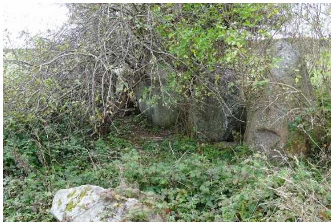
De fleste af de store randsten er skjult i opvækst