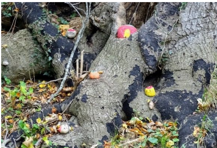
Stendyr på en gammel bøgestub

Langs Filosofgangen og Mølleediget kan man møde mange sjældne fugle, Lille Flagspætte og Huldue, og er man overordentlig heldig kan man møde billen 'Eremit', som er rød-listet som udrydningstruet i hele dens udbredelsesområde, og som er baggrunden for at området er udlagt som både Natura2000 område og habitatsområde. Derudover kan man møde en del street-art i form af farvede bolde og stendyr, så der er meget at opleve ved en tur ad Filosofgangen.