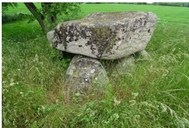
Ved forcering af mindesmærket kunne de 2 flotte kamre besigtiges, her det nordligste.