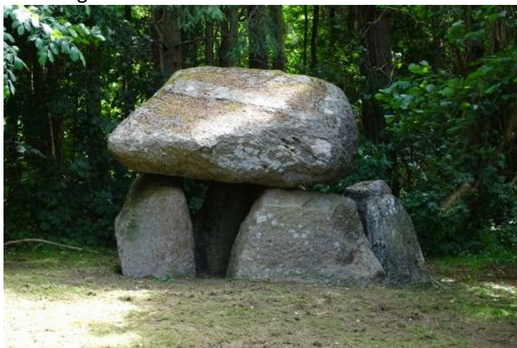
Et af de flotte fortidsminder som arbejdsgruppen besøgte på sin tur rundt i kommunen.

I 2021 har arbejdsgruppen besøgt en lang række markante fortidsminder i kommunen og afleverer efterfølgende en rapport til Sorø Kommune, for at inspirere Kommunen til at tage hånd om 'den lille natur' både hvad angår pleje og formidling.