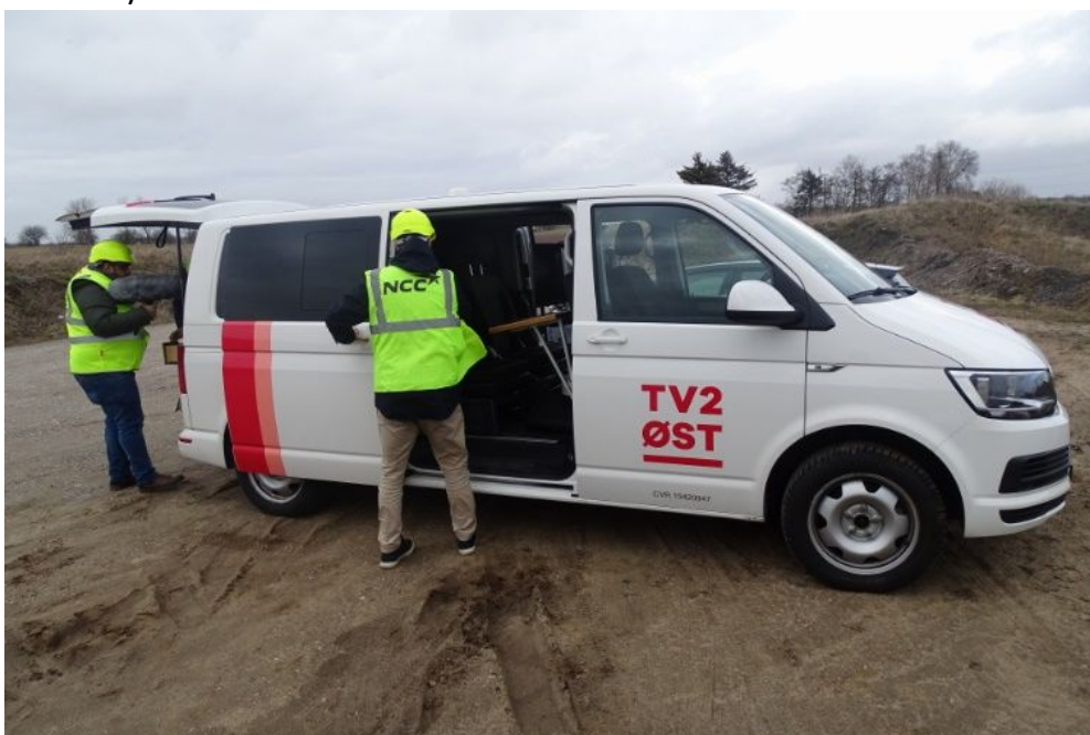
TV2 Øst stillede op med deres reportagevogn for at fortælle historien om Strandtudsens i Munkebjergby grusgraven

Arbejdsgruppen deltager i DNs netværk omkring råstofgrave, med ovenstående som hovedindgangsvinkel, men også generelt for at sikre en fornuftig brug af råstofferne og en stor hensyntagen til de områder, hvor man ønsker at indvinde nye råstoffer.