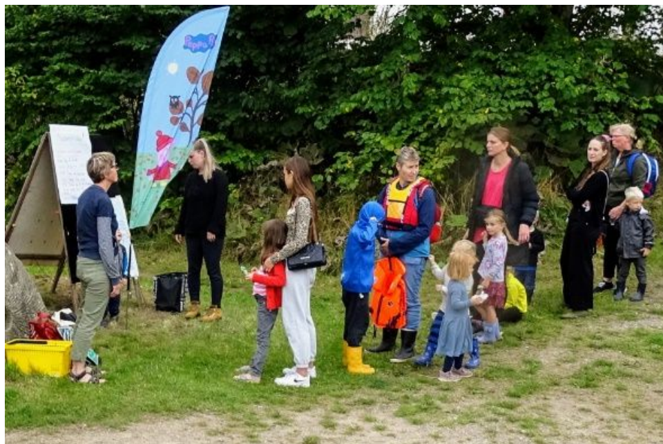
Lang kø for at komme i gang med Gurli Gris naturstien

Der kom løbende besøgende til de forskellige arrangementer over hele dagen, men særligt var Gurli Gris naturstien mellem kl. 13:30 og 15:30 godt besøgt. Der blev registreret lidt over 300 besøgende (børn og voksne) i løbet af hele dagen. Desværre var der en del aktører, der ikke havde mulighed for at deltage i år, men de har meldt tilbage, at vi gerne må kontakte dem igen i 2022. De aktører, der deltog, var tilfredse med arrangementet, og vil gerne deltage igen næste år.