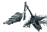
bog - bøgens frø

være blandt de flotteste i Danmark. En del af bøgebevoksningerne er særligt udvalgte – forstfolkene siger »kårede« – så frøet fra dem må handles. På arealet nord for Næstvedvej er der høstet adskillige tons bøgefrø, som via en mellemstation på danske planteskoler vokser frem som ny bøgeskov i Danmark. Bøgen befinder sig i Danmark nær nordgrænsen for dens udbredelse, hvilket bl.a. udmønter sig i, at den ikke bærer frø hvert år. I gennemsnit over en lang periode sker det ca. hvert 7. år, men de seneste 15 år har der været hele seks frøår. Gå til venstre ad Næstved Landevej frem til 1. skovvej på højre hånd.