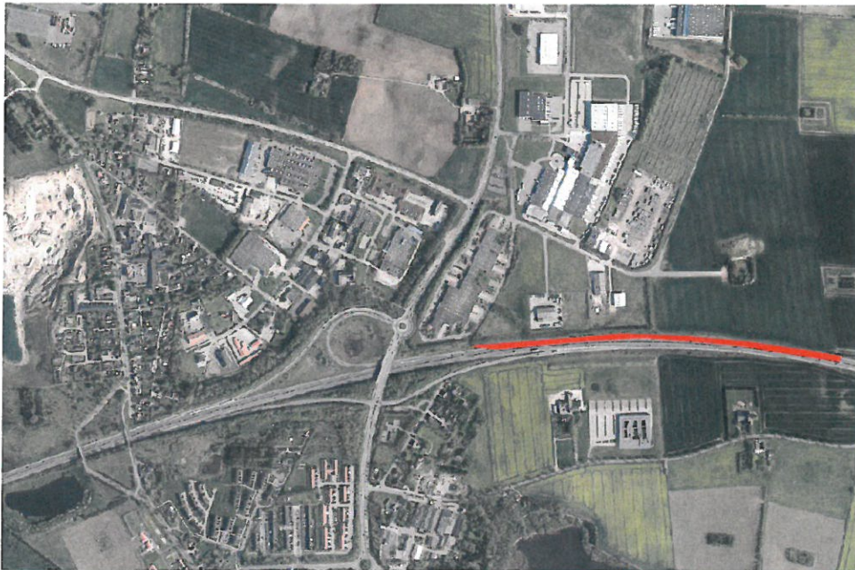
Kortet viser strækningen (ca. 1,1 km), hvor kommunen ønsker at virksomhederne skal kunne skilte.

Den 30. juni 2015 J.nr. 340-2014-40304 Sag vedr.