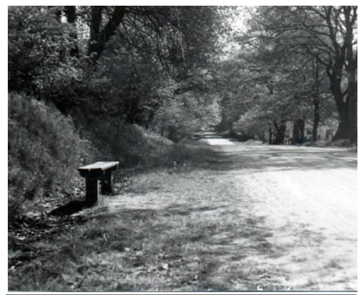
Fægangen før fredningen Lokalhistorisk arkiv

Banevejs Allé Fredet allé på vejdamning til stationen