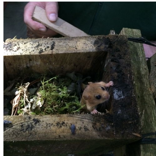
Hasselmus i en af de mange opsatte redekasser

Der bør foretages en uddybende registrering af tilstedeværelsen af truede dyr og planter, således at kommunen i sin sagsbehandling kan tage højde herfor i sine godkendelser af arealanvendelsen. Ligeledes er det vigtigt, at dette indgår i den kommunale planlægning og fremtidig revision af Naturkvalitetsplanen.