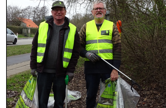
Formand og næstformand samler affald